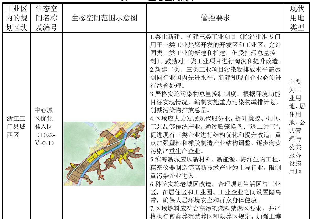
表 2-1 生态空间清单